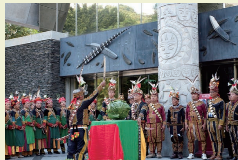
開幕當天大頭目揭壺儀式