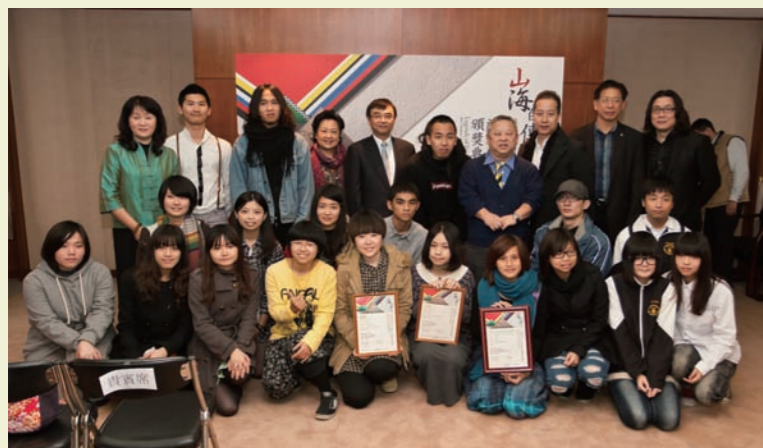
得獎者與評審老師合照