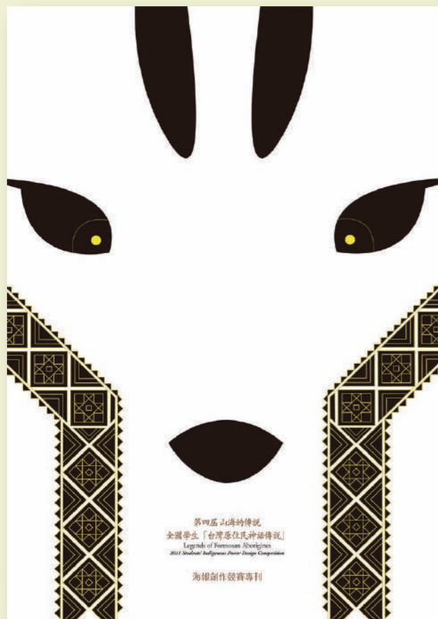
本屆海報展以金獎之得獎作品作為專刊封面

出版:順益台灣原住民博物館 指導贊助單位:文建會 贊助單位:台灣佳能資訊股份有限公司 ISBN:1331774848 (平裝)