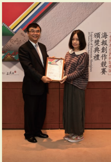
金獎 曾宜雅同學與館長合照